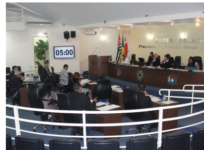
Vereadores aprovam projetos do Prefeito Municipal