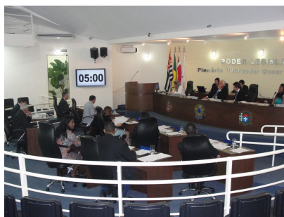
Vereadores discutem requerimentos

As futuras respostas dos requerimentos poderão ser visualizadas no link a seguir: www.camaraparaguacu.sp.gov.br/materias-legislativas